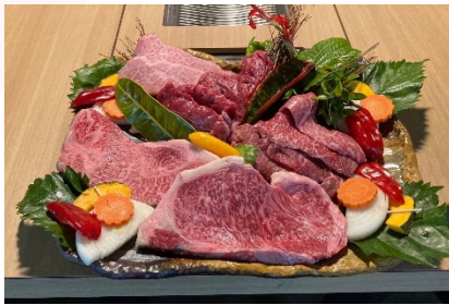
石垣牛料理 - 4 人套餐